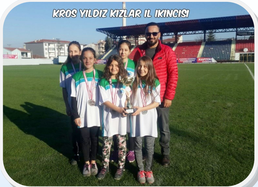
KROS YILDIZ KIZLAR IL IKINCISI